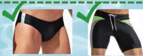
Maillot de bain, boxer en Lycra