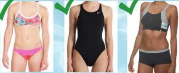
Maillot de bain, 1 ou 2 pièces, en Lycra