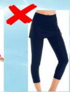
Maillots en DESSOUS DU GENOU, Burkinis