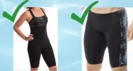
Maillots au dessus DU GENOU, en Lycra

Les t-shirt UV sont tolérés pour les enfants.