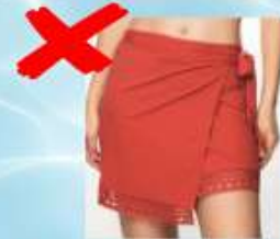
Jupes de bain, paréos