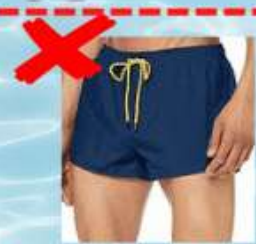
Shorts de BAIN (plage), short de sport